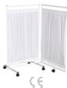
Zástěna nízká dvoudílná látková – ZN2L

ŠxHxV(složené) : 75 x 51 x 110, ŠxHxV(rozložené) : 148 x 51 x 110, hmotnost 8 kg