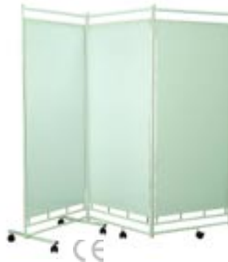
Zástěna vysoká třídílná plastová – ZV3P

ŠxHxV(složené) : 75 x 51 x 190, ŠxHxV(rozložené) : 222 x 51 x 190, hmotnost 26 kg