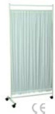
Zástěna vysoká jednodílná látková – ZV1L

Rám zástěny je vyroben z ocelových trubek s povrchovou úpravou práškovým lakem. Zástěny jsou vyráběny ve vysokém a nízkém provedení s látkovou nebo plastovou výplní. Látková výplň je pratelná a velmi snadno vyjímatelná. Zástěna je dodávána s brzděnými plastovými kolečky o průměru 50 mm. Na přání zákazníka je možno dodat v libovolné barvě látkové výplně a barevného odstínu konstrukce. Dále lze dodat zástěnu i v celonerezovém provedení.